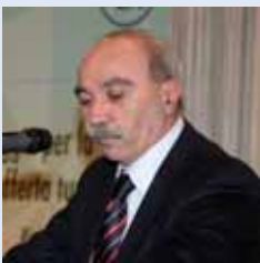
Maurizio Melucci, Vice Sindaco e Assessore al Turismo Comune di Rimini

All'Assemblea di OASI-CONFARTIGIANATO sono intervenuti i massimi esponenti della pubblica amministrazione locale. Maurizio Melucci, Vicesindaco di Rimini e Assessore al Turismo, ha affrontato diversi temi: "Concordo da sempre sulla centralità del turismo balneare, ma è anche necessario che il Governo riveda la legislazione sul turismo finanziando l'innovazione di prodotto. L'industria turistica non ha mai ricevuto nulla sotto questo aspetto, eppure rappresenta il 12-13% del Pil nazionale. Sulla prossima stagione nessuno è in grado di fare previsioni credibili, i segnali dai mercati esteri sono pessimi e anche il mercato interno non offre grandi prospettive".